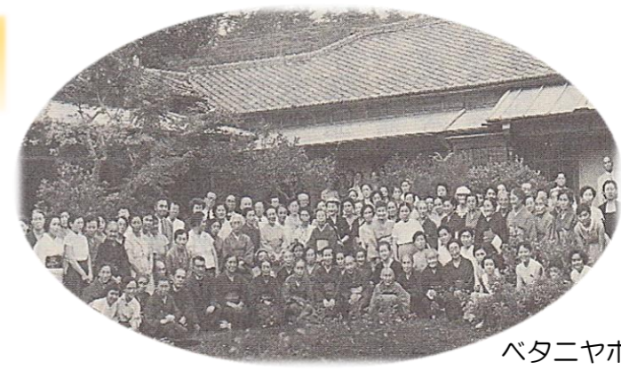
ベタニヤホーム開所式 1956年