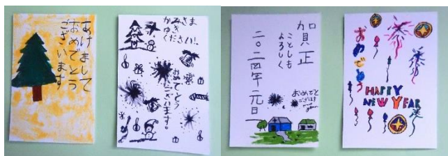
書道授業で書いた年賀状(国際子ども学校)

感謝箱献金の活動は小さな川の流れかもしれません。けれども、水が流れ続けている限り、いつか荒れ地が緑に覆われ、作物が実り、大人も子ども一緒に喜び踊る世界が実現することを願って祈ります。「み心がおこなわれますように」。