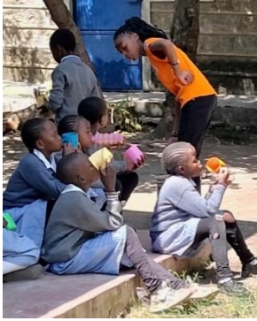
11 時におかゆを食べる

ケニアにあるサイディアフラハでは児童養護施設と幼稚園・小学校をおもに運営しています。