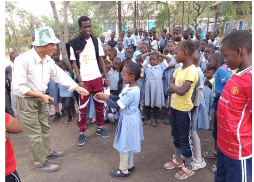
3 学期終了時、成績の良かった児に賞品授与

この年はその後、児童減少を克服するために、より授業内容や先生たちの質を向上させるように努めました。児童に教科書を貸出したり、読み聞かせの時間を多く取るようにして改善させたことです。そこで 2024 年の初めには、不況によって公立小学校へ行く児童は相変わらず多かったのですが、先生の授業の質が回復したために、入学する児童は増えました。今はまだ、学校が始まったばかりなので、この増減数は正確に把握できていない状況です。