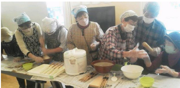
天神復興住宅チームキリタンポによる「キリタンポを作って食べる会」チームキリタンポは大館聖パウロ教会と仙台基督教会の有志でつくられています

これからも地域支援団体として被災者に寄り添っていければと願っています。コロナ禍で傷ついたコミュニティの再生と維持に努め、被災地域の発展に寄与できればと思います。また我々の活動を通して主イエス・キリストの希望が被災地に広がることを望みます。どうかこれからも皆さんと共に歩むことができれば幸いです。よろしくお願いいたします。