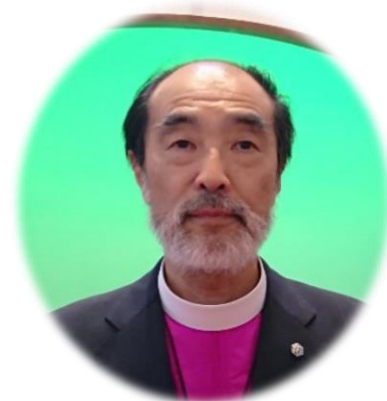
東北教区主教 フランシス長谷川清純

日本聖公会正義と平和委員会「原発問題プロジェクト」のホームページおよびニュースレター『いのちと海と空と大地』をご覧ください。