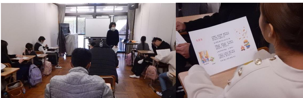
小学生～高校生の3クラス合同で行っている音楽の授業

昨年度、フィリピンの高校を卒業する前に来日した子どもについて、通える学校がない、日本語を学ぶ場所もない、といった問い合わせが複数ありました。そこで、これまで中学生までとしていた対象年齢を、今年度より高校生まで広げることにしました。1 月現在 22 名のうち高校生年齢は 6 名。「大学に行きたい」「仕事をするまでに日本語の読み書きを勉強したい」等、夢や目標をもって通っています。