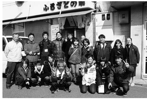
「ふるさとの家」前で朝ミサを受けた高校生たち

『では、わたしの隣人とは誰ですか』の主題で「J's キャンプ@釜ヶ崎・大阪」は大阪聖愛教会を拠点に3月25日（金）から3泊4日で行われた。初の京都・大阪合同キャンプ。参加者は京都・大阪各3人の高校生6人。スタート直後はぎこちなかった参加者もキャンプ終了時にはスタッフも含めて旧知の如くとなっていた。 キャンプ初日「野宿を強いられる人の思いと夜回り」について学び、翌日、釜ヶ崎の三角公園での炊き出しのお手伝いに参加した。が、いきなり先制パンチを食らった。食事を作るのだから、と三角中で頭をおおって行った。段取り説明をリーダーの方から受けようとした時、「その恰好はなんなんだ。炊き出しを受ける人たちと違和感のないようにしてもらわないと手伝わってもらうことは出来ない」とお叱りを受けた。隣人に寄り添うとは、を突き付けられた。当日の炊き出しは700食を超えた。 夜、「子どもの里」の子どもの夜回りに参加。段ボールで囲って小さくなって眠るおっちゃんたち。車道の端で毛布一枚で朝から何も口に出来なかった人もいる。子どもたちは「味噌汁とおにぎりあるけどいる？元氣なん？」と声をかけて回る。おっちゃんたちも子どもたちに語りかける。私たちも子どもたちに