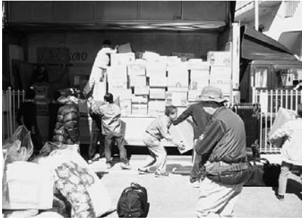
トラックへの物資の積み込み