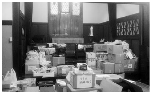
釜石神愛教会に集まった救援物資

釜石市では津波に襲われた市街地・住宅地を目の当たりにしました。港を持つ釜石市街地の家屋や車には、そこで遺体が発見されたという印、遺体を運び出したという印がいたる所に書かれていました。ある家屋の三階の割れた窓か