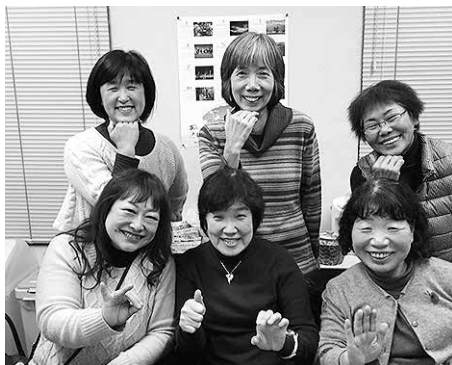
前列：指文字で「つたえて」。 後列：「待っています」。

私たちは教会手話通訳の奉仕をするグループです。教区内の大きな礼拝で会衆に向かつて立ち、とても目立ってしまうのが私たちの奉仕の姿です。聞こえない人たちの第一言語である手話で、聞こえる私たちが礼拝のすべてを表すのは本当に難しく、伝わっていないのだろうかといつも悩みながら奉仕しています。