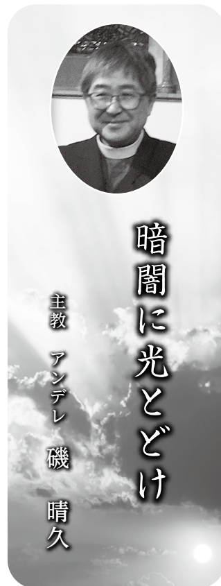
主教 アンデレ 磯 晴久

神の憐れみ深いみ心によって あげぼの光がわたしたちに臨み 暗闇と死の陰にいる人を照らし わたしたちの足を平和の道に導く (祈祷書 24頁 朝の礼拝 ザカリヤの賛歌より) 主イエス・キリストのご降誕を心よりお祝い申し上げます