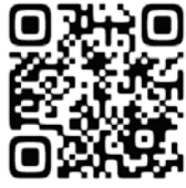
磯主教 メッセージ QR

何もできないからである。」(ヨハネ15・5)です。神の国を目指す旅は、イエス様を離れては続けられません。どうぞ、私たちがイエス様から離れずに旅を続けていくことが出来ますようにお祈りします。「清里への道」が祝福されますように。