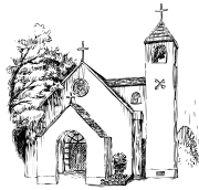
西宮聖ペテロ教会