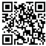
最新情報 ブログページ

今年の11月10日(金)〜13日(月)に山梨県清里にある清泉寮で開催される「日本聖公会宣教協議会」には各教区から教区主教、宣教担当を含めて8人、そして日本聖公会総会で定められた各委員会などの諸部門の代表、そして実行委員が集まる予定です。そして、協議会のプログラムの多くはオンライン配信を予定しており、実際に清里に集まるメンバーだけではなく日本聖公会につながる皆さんと一緒に時間を共有し、今後の日本聖公会の歩みについて思い