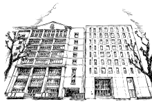
大阪聖アンデレ教会