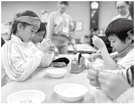
工作コーナーでお土産作り

4月29日(月・休) 大阪教区キッズフェスティバルには、子ども56人、保護者スタッフ合わせて総勢125人が川口基督教会に集められました。テーマは「イエス様が一緒になら」ルカ8章22節「嵐を静めたイエスさま」の箇所です。イエス様は起き上がり、嵐と荒波を叱り、嵐が静まったという出来事から、どんなことがあってもイエス様と共に歩むというメッセージが語られました。 参加する子どもたちはもちろんですが、引率の保護者も、高校生や青年のスタッフも含まれた企画者側も、皆が楽しみ、締めくくりの礼拝後、本当に神様との時間に満足するという点です。 私は幾人かのスタッフに注