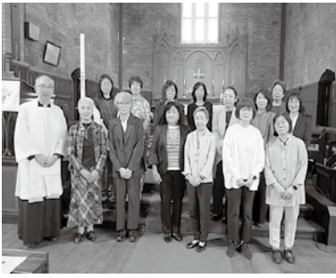
新会長と新役員集合写真