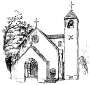
西宮聖ペテロ教会