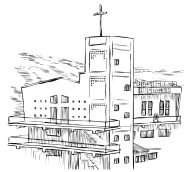
東豊中聖ミカエル教会