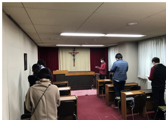
教区センター内 チャペル

さらに、目に見える「変容」としては、京都教区ビルの次なる事業者への引き渡しが進んでいるため、年度初めに、同ビル内にあったチャペル機能をニコルス館内のコモンルームへと暫定的に移設し仮チャペルとした(写真参照)。その他、近年特に本館の課題として意識を高めているのは信徒の奉仕職養成についてであるが紙幅の関係でこれについては稿を改めたい。さらに永年に渡る継続的な課題としてはやはり財政の問題が挙げられる。すでに恒常化しつつあるが、低金利時代が続き基金が果実をほとんど生まなくなっていることから、依然として財政難であることに変わりはない。後援会への入会の呼びかけと神学館の教育内容のアピールのため3年前には大阪教区の諸教会を巡っていたが、これもコロナの影響で現在はストップしている。今後とも神さまのみ旨にかなう神学教育のため皆様のご加禱、ご支援をよろしく願いいたします。