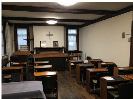
ニコルス館内 仮チャペル