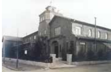
戦前の教会一大きい！