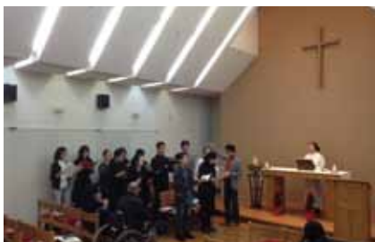
ハモリ隊によるアンセム