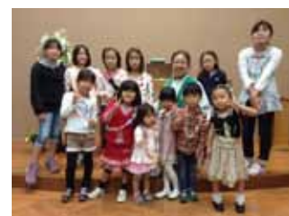
こひつじ会のメンバー