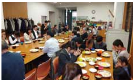
毎週行われる愛餐会