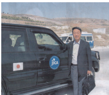
移動は防弾車で (パレスチナJICAプロジェクト)